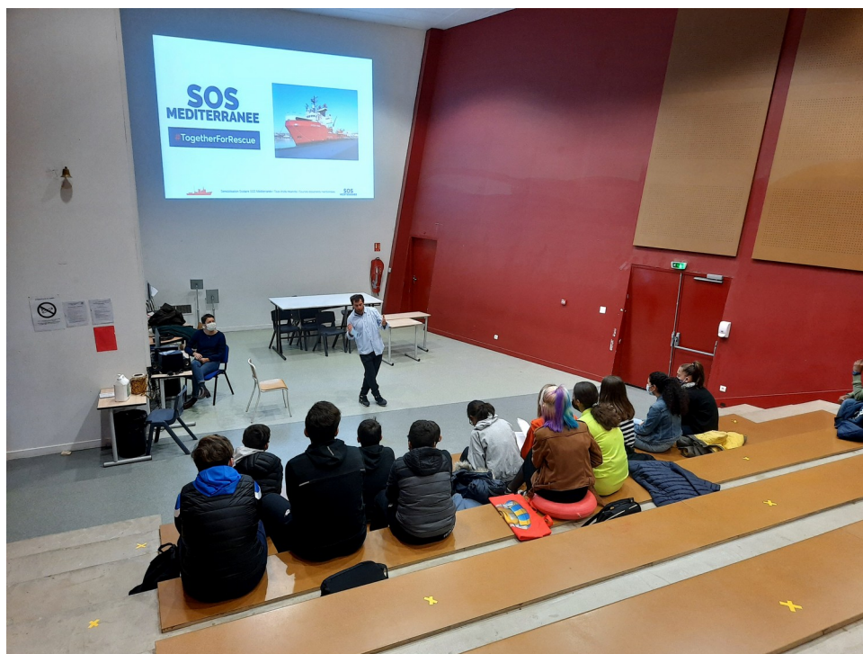
← Une classe de 4° captivée par les bénévoles de SOS Méditerranée

Ils nous ont également montré deux vidéos dont une était l'interview d'un migrant qui racontait les raisons de son départ : il fuyait la violence de son pays. Il racontait aussi la brutalité des passeurs au moment de l'embarquement. Et la deuxième projection était une vidéo de sauvetage pendant leur travail.